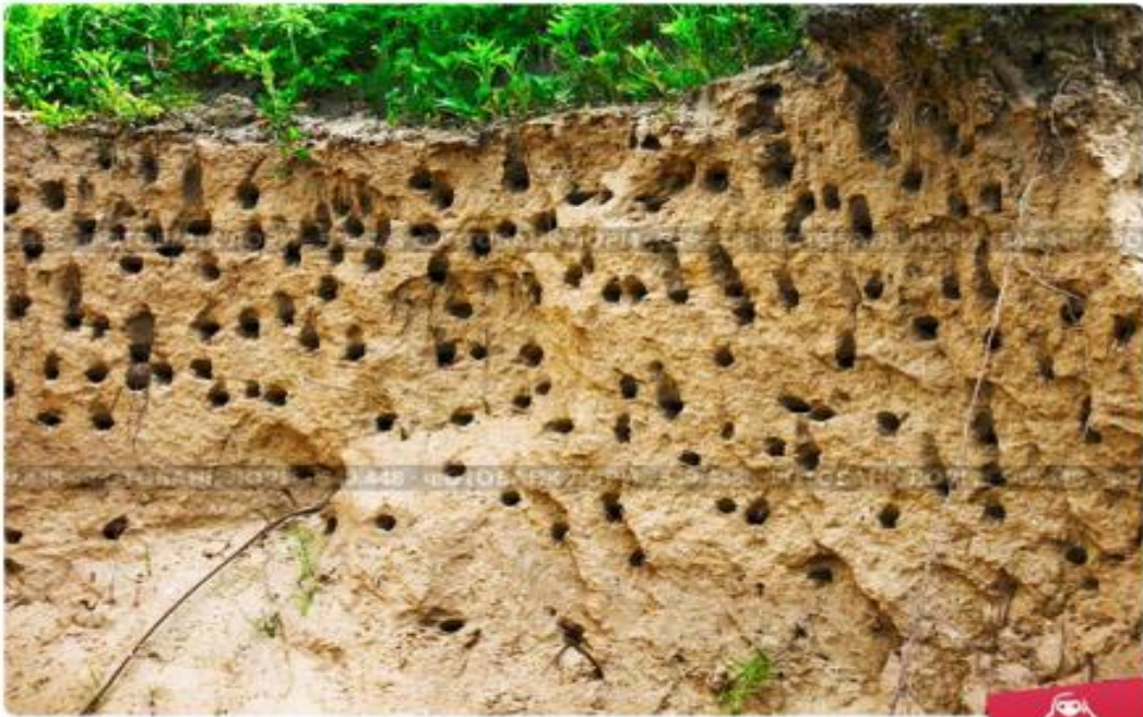
Птичьи гнезда в обрыве реки